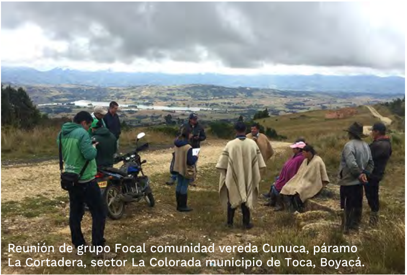
Reunión de grupo Focal comunidad vereda Cunuca, páramo La Cortadera, sector La Colorada municipio de Toca, Boyacá.

Entidad ejecutora: Departamento de Boyacá Tipo de OCAD: Departamental BPIN: 2012004150025