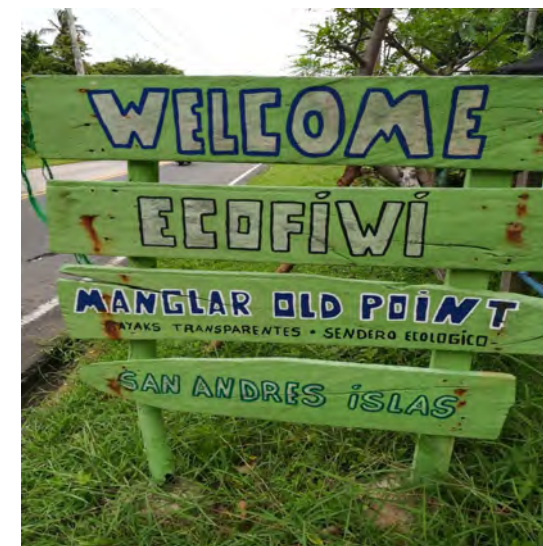
Iniciativa Productiva Guianza Turística ECOFIWI Vía San Luis, sector Mango Tree, San Andrés Islas

Entidad ejecutora: Corporación para el desarrollo Sostenible del Archipiélago - CORALINA Tipo de OCAD: Regional Caribe BPIN: 2013000020045