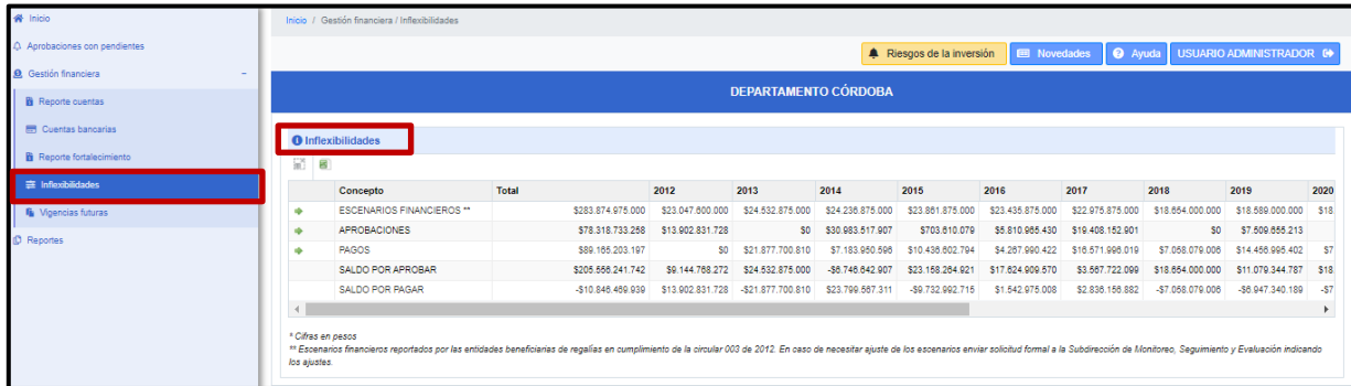
Imagen 1: Balance de inflexibilidades

Al ingresar al módulo de Inflexibilidades se presenta el balance de aprobaciones y pagos asociados a compromisos adquiridos antes del 31 de diciembre del 2011 financiados con recursos del régimen anterior. Si la entidad no tiene este tipo de compromisos esta sección aparecerá vacía.