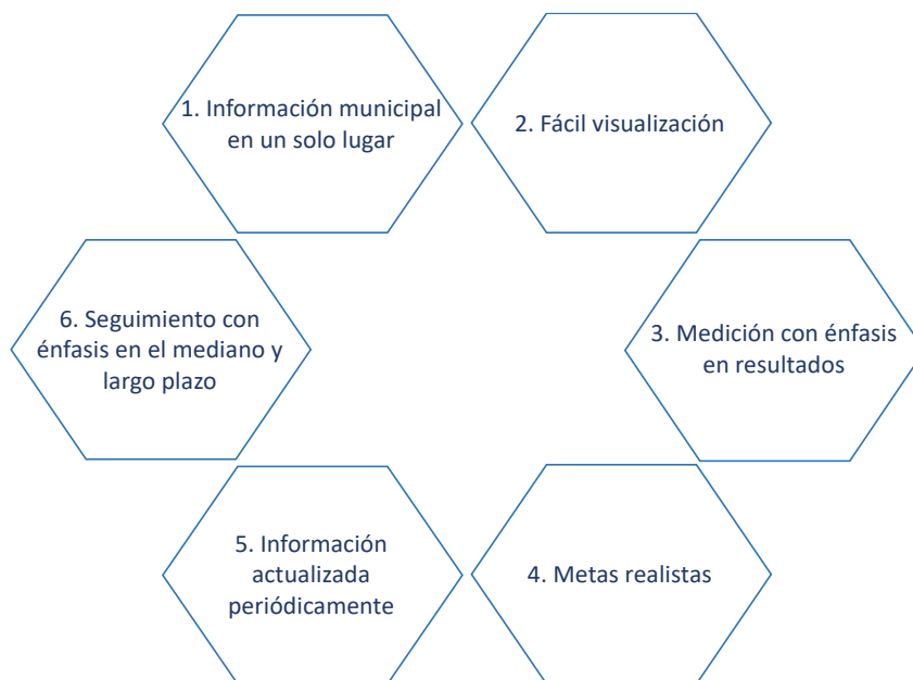
Figura 3-1. Beneficios Metodología de Cierre de Brechas