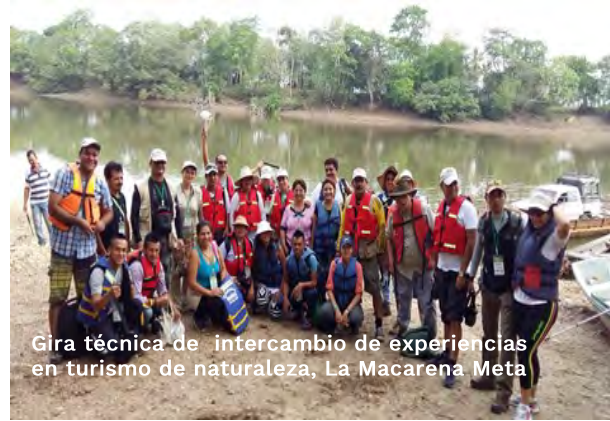
Gira técnica de intercambio de experiencias en turismo de naturaleza, La Macarena Meta

Para evaluar el proyecto “Inversiones para la preservación y restauración de ecosistemas a través del aprestamiento de las cadenas de valor en Caquetá, Putumayo y Amazonas”, se aplicaron los siguientes instrumentos en los municipios de Mocoa, Orito, Puerto Asís (Putumayo) y Leticia (Amazonas):