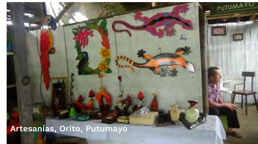
Artesanías, Orito, Putumayo

Entidad ejecutora: CORPOAMAZONÍA Tipo de OCAD: Corporaciones Autónomas Regionales BPIN: 20133223000029