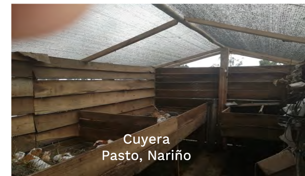
Cuyera Pasto, Nariño

Para evaluar el proyecto "Restauración ecológica y conservación de áreas estratégicas en zonas de recarga hídrica en la subregión centro departamento de Nariño", se aplicaron los siguientes instrumentos en municipios de Pasto, Chachagüi, La Florida, Nariño: