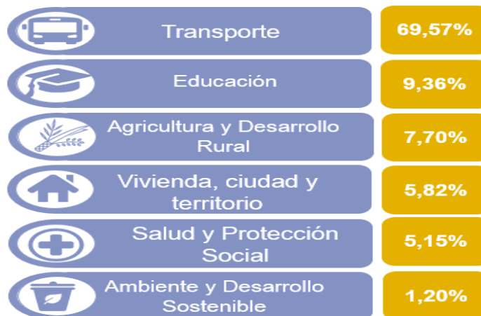
Porcentaje del valor SGR AIR 40% en trámite