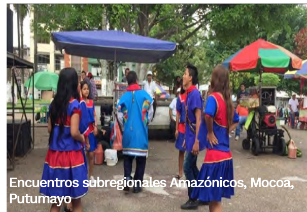
Encuentros subregionales Amazónicos, Mocoa, Putumayo

Para evaluar el proyecto “Fortalecimiento de las prácticas tradicionales asociadas a la biodiversidad y ambiente en comunidades indígenas y afrodescendientes en Amazonas, Caquetá y Putumayo”, se aplicaron los siguientes instrumentos en Santiago, Colón, Sibundoy, Mocoa (Putumayo) y San José de Fragua (Caquetá):