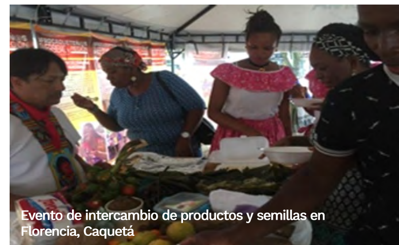
Evento de intercambio de productos y semillas en Florencia, Caquetá

Sector Ambiente y Desarrollo Sostenible* Sistema de Monitoreo, Seguimiento, Control y Evaluación (SMSCE)